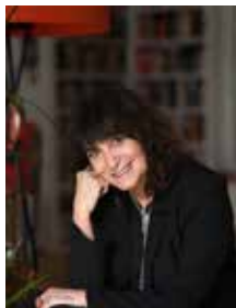
Figura prominente en el mundo de la literatura y el periodismo en el mundo hispanohablante, galardonada con el Premio Nacional de las Letras en 2017 y la Medalla de Oro al Mérito de las Bellas Artes en 2022, Rosa Montero es autora de una obra

original y abundante. Aborda, siempre con frescura y éxito, varios géneros literarios como la poesía, la narrativa (ciencia ficción, novela negra), el teatro y el ensayo. Su obra fue ampliamente adaptada al teatro y al cine y sus libros están traducidos a más de veinte idiomas.